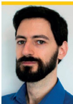
Médico Assistente de Medicina Legal Presidente da Comissão Nacional de Medicina Legal e Elemento do Secretariado Nacional do SIM